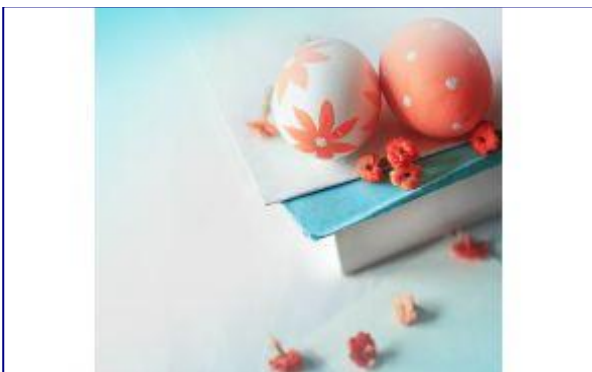
Otroški kotiček pri recepciji hotelov, 25.3.2016