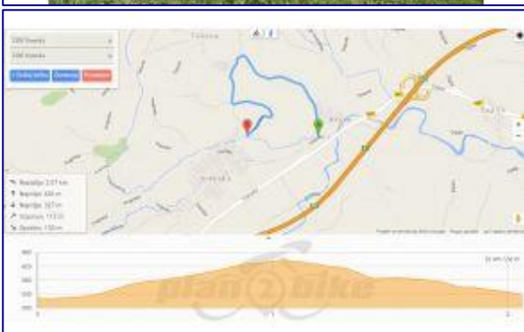
Tek na Briše za vse starosti po razgibanem terenu v centralnem delu občine Vransko. Start teka za